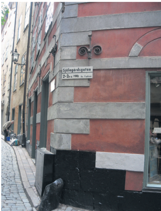
Själagårdsgatan. I fönstret, till höger i bilden, sitter en "fusklapp" för åldersbestämning av ankarslutar.