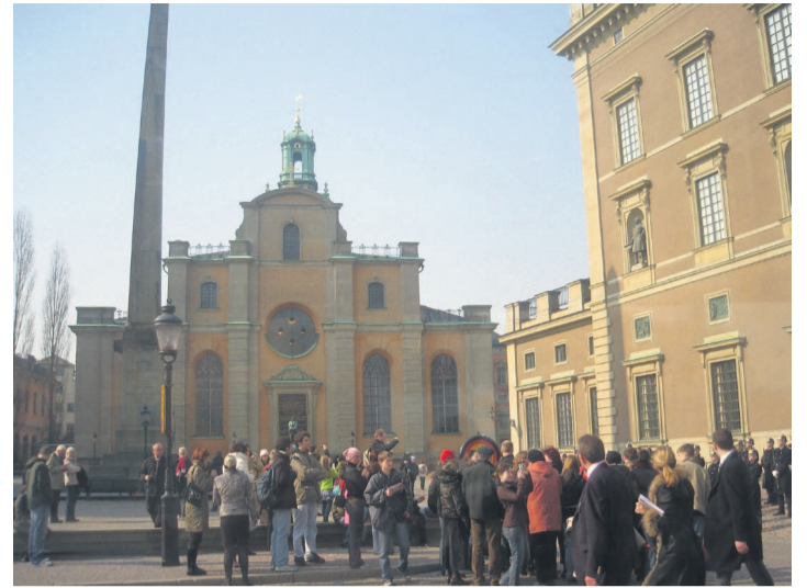
Starten sker förstås vid Slottsbacken.

Åter på Köpmangatan går vi ner mot Köpmantorget och kastarblicken mot "Sankt Görans och Draken" i brons, från 1912. Naturligtvis berättar jag också om förlagani Storkyrkan: Nordeuropas främsta medeltida skulpturgrupp i ek av Bernt Notke 1489!