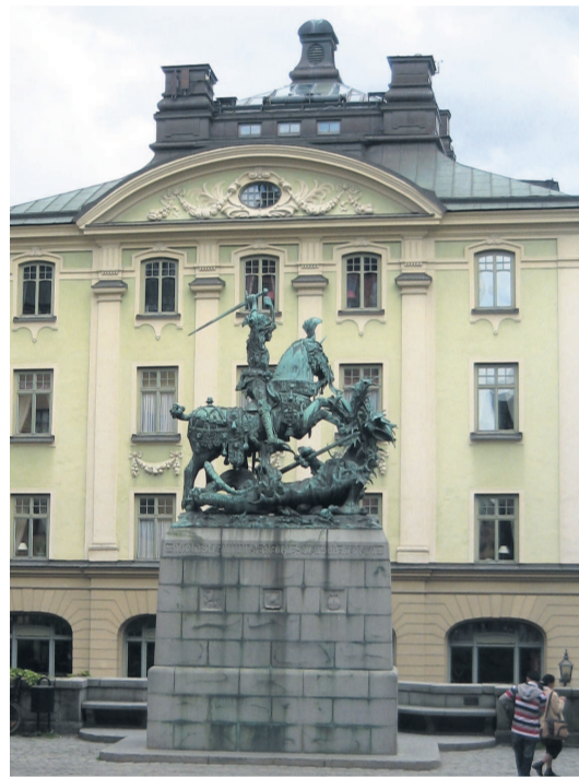
Sankt Görans och draken på Köpmantorget.

seet som invigdes 2001 i samband med hundraårsfirandet av Nobelpriset. I museibutiken kan man köpa Nobelmedaljer i choklad (samma färg och storlek) och man kan fika på Kafé Satir inne i museet eller äta samma sorts Nobelglass som serveras på middagen på Stadshuset!